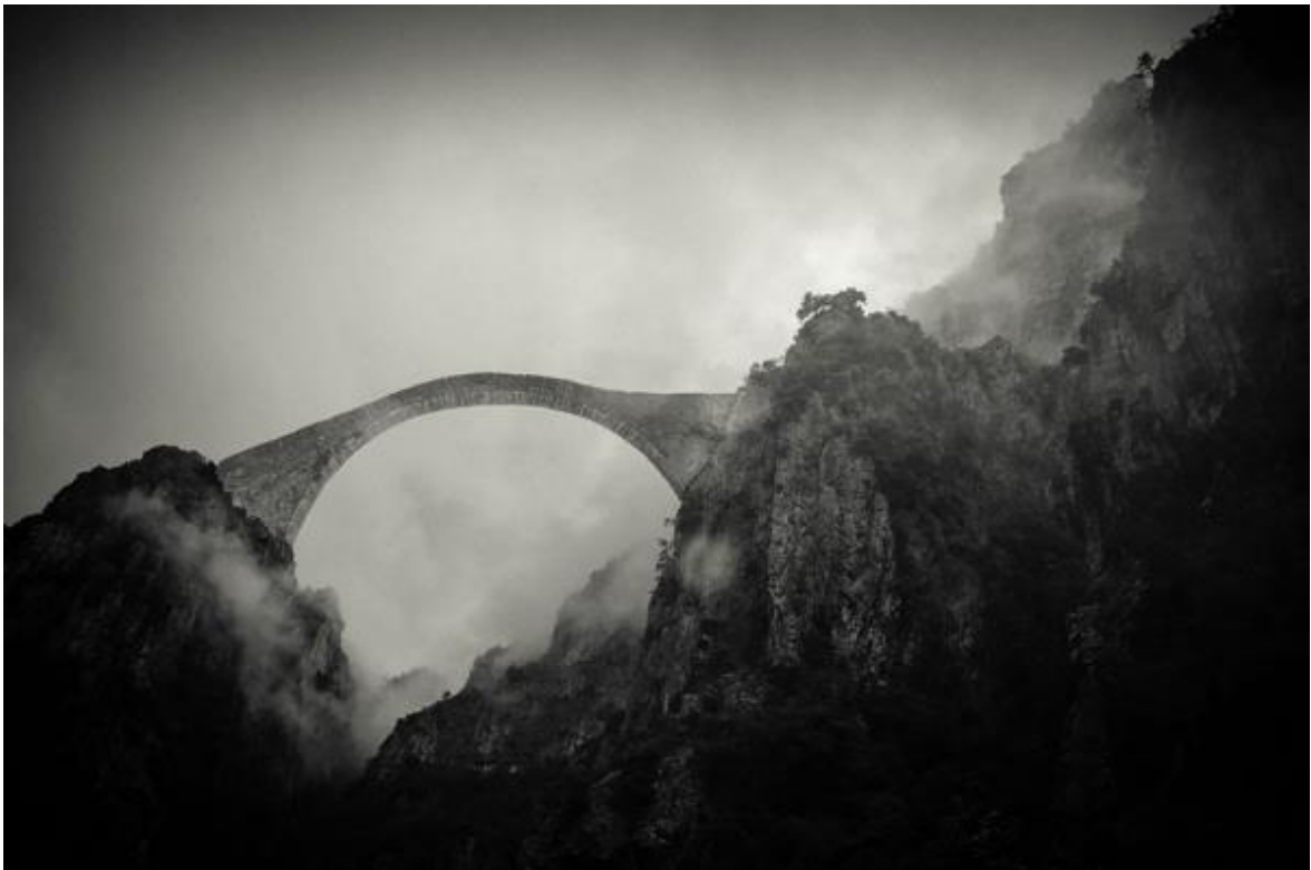
Горы Пиндос, Греция