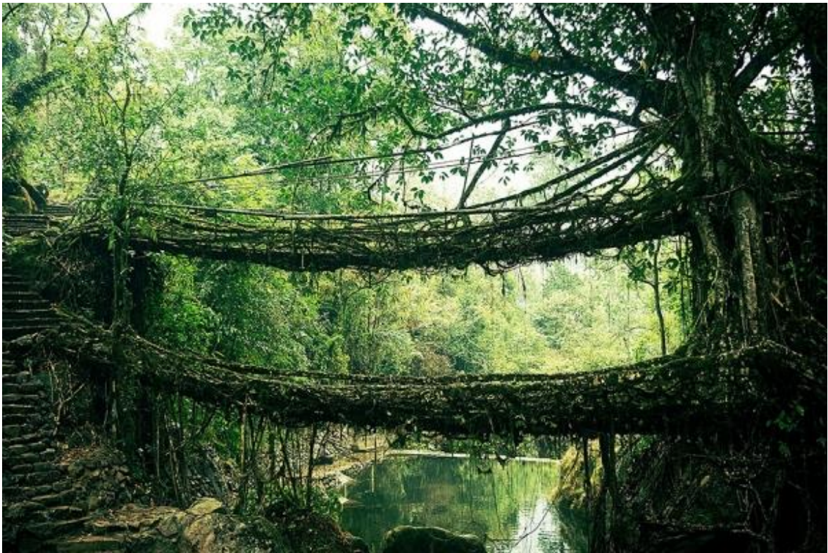
Мост из корней, Индия