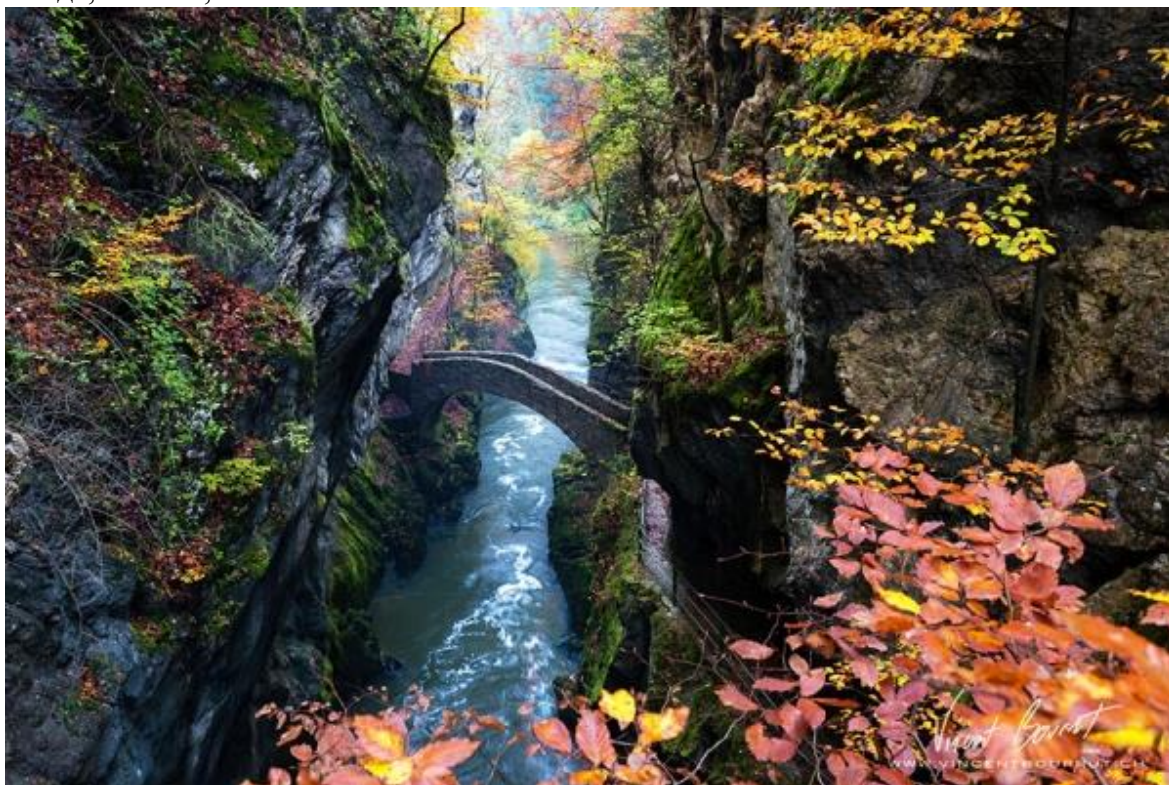
Мост Gorge De L'areuse, Швейцария