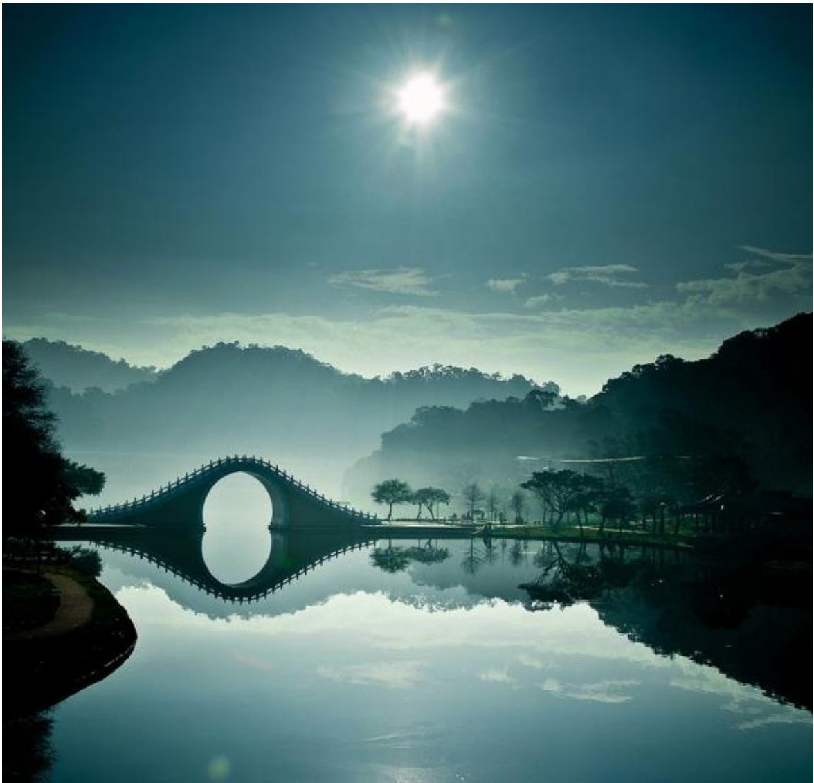
Лунный Мост - Тайбэй, Тайвань