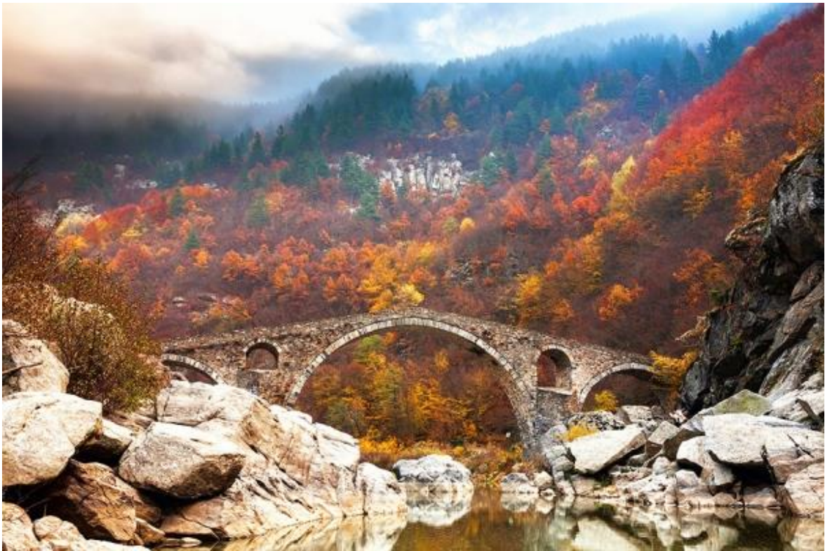
Чертов Мост в горах Родопы, Болгария