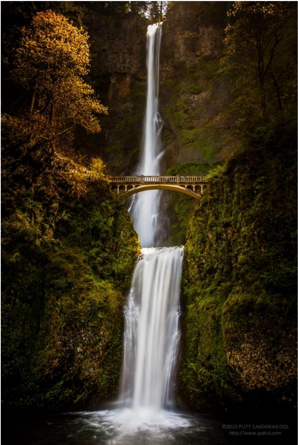
Водопад Малтномах, Орегон, США